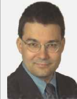
Augen zu und durch!

Reviews sind grundlegende Techniken der Qualitätssicherung, da Fehler früh im Entwicklungsprozess gefunden werden können und damit bei entsprechender Anwendung enorme Fehlerkosten eingespart werden können.